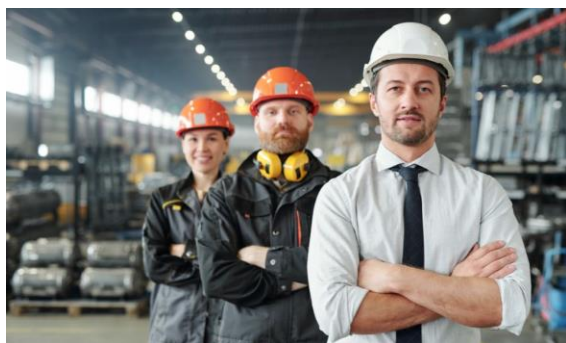
Zarządzanie zespołem produkcyjnym i logistycznym

Zapraszamy do zapoznania się z ofertą naszych szkoleń dla liderów produkcji i logistyki ( kliknij w obrazek i odwiedź naszą stronę )